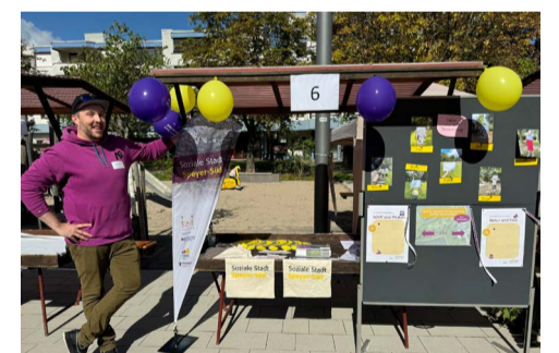
Das Quartiersmanagement ist auch 2024 wieder beim Herbstmarkt dabei