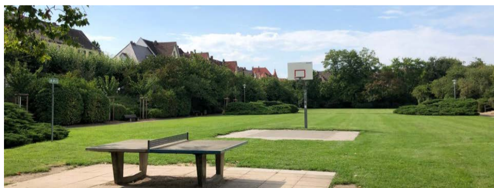
Bleiben in neuer Form erhalten: Tischtennisplatte und Basketballkorb im Feuerbachpark

schlossen sein, um den Vorgaben des Bundesnaturschutzgesetzes zu entsprechen. Anschließend beginnt im April die eigentliche Umgestaltung der Anlagen, nachdem die öffentliche Ausschreibung erfolgreich abgeschlossen wurde. Insgesamt werden mehr Bäume neu gepflanzt als entfernt.