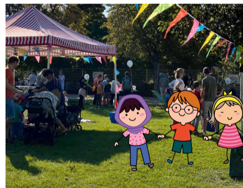
Buntes Treiben auf dem Platz der Stadt Ravenna, Platz der Kinderrechte

Nach der erfolgreichen Premiere 2023 fand am 20. September 2024 erneut das SüdKids-Kinderfest auf dem „Platz der Kinderrechte“ in Speyer-Süd statt. Passend zum Weltkindertag standen die Kinder im Mittelpunkt des Festes, das vom Stadtteilverein Speyer-Süd e. V., dem Quartiersmanagement und dem Familientreff Süd organisiert worden war. Zahlreiche Familien folgten bei strahlendem Sonnenschein der Einladung und freuten sich über vielfältige kostenfreie Angebote wie Kinderschminken, Basteln, Ballonmodellage, Dosenwerfen und mehr. Dank einer Stempelkarte erhielten die Kinder zudem kostenfrei Kuchen, Getränke und Hot Dogs.