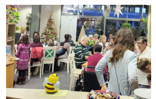
Für Jung und Alt: Adventscafé des Stadtteilvereins