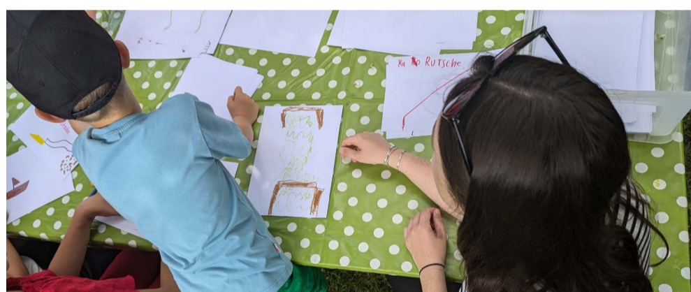
Hort-Beteiligung: Kinder zeichnen ihre Ideen für den Spielplatz

Beim Schulfest der Grundschule im Vogelgesang am 26. Juni wurden die Vorschläge weiter konkretisiert. Besonders die geplante Zonierung nach Altersgruppen stieß auf großes Interesse. Neben Ideen zu Spielgeräten wie einer Seilbahn, einer großen Rutsche und Klettergerüsten wurden auch Vorschläge für ein Motto des Spielplatzes gesammelt.