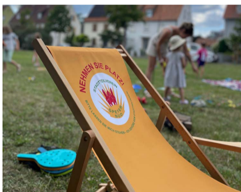
Der Stadtteilverein stellt Liegestühle aus dem Verfügungsfondsprojekt „Nehmen Sie Platz“ zur Verfügung

8. August 2024 Sommertreff auf dem Platz der Stadt Chartres