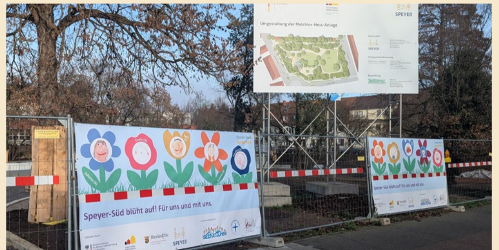
Jeweils zehn unterschiedliche Bauzaunbanner mit Kinderporträts hängen an den beiden Parkbaustellen im Stadtteil

Nach Projektabschluss sollen die Bauzaunbanner durch Upcycling in neuer Form weiterverwendet werden. So bleibt der Bezug zum Förderprojekt „Soziale Stadt Speyer-Süd“ und zur Städtebauförderung auch über das Förderende hinaus erhalten.