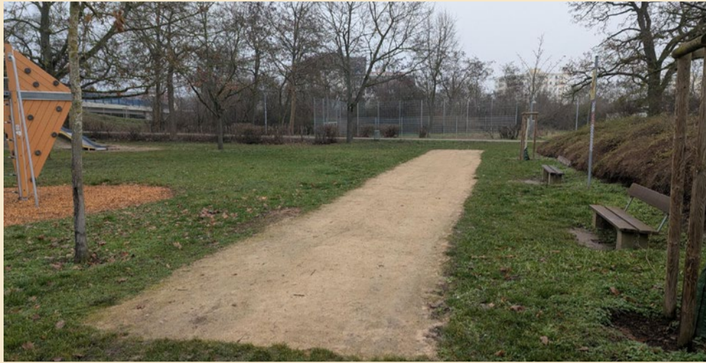
Ein Meter zu schmal für Wettkämpfe: die alte Boulebahn auf dem Spielplatz Vogelgesang

Umsetzung der aktuellen Verfügungsfondsprojekte in vollem Gange