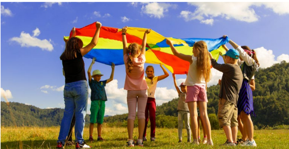
Zusammen aktiv: Beim Kindertreff erleben Kinder Spiel und Gemeinschaft

Jeden Freitag von 15 bis 17 Uhr wird während der Schulzeit im Familientreff Speyer-Süd gespielt, gebastelt, gelesen und gekocht. Denn immer dann findet der „Kindertreff“ der Jugendförderung statt. Das kostenfreie Angebot richtet sich an alle Kinder im Grundschulalter aus Speyer.