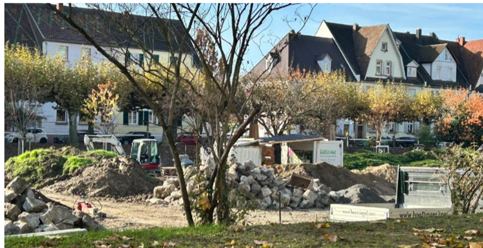
In einem halben Jahr werden die Bagger im Feuerbachpark abgezogen sein

Vermutlich im Januar erhalten alle Wege im Park eine neue Oberfläche. Danach werden zunächst die Wege am westlichen Rand wieder für die Öffentlichkeit freigegeben, während die Parkfläche mit Sport- und Spielbereich bis zum Abschluss der Arbeiten gesperrt bleibt. Im Frühsommer kann der gesamte Park wieder geöffnet werden, mit neuen, angenehm begehbaren Wegen und frischem Grün, das zum Spazieren, Spielen und Verweilen einlädt.