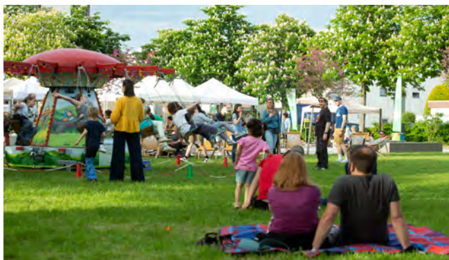
Frühlingsfest in Kooperation mit der Kita St. Markus