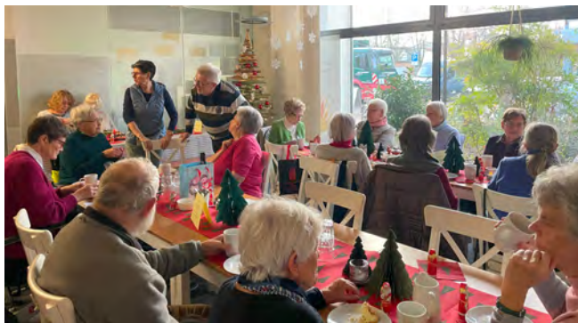
Adventsfeier im Stadtteil-Café