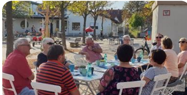
Stadtteil-Café wegen Sonnenschein draußen ☺