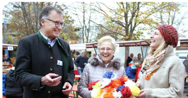
3. Herbstmarkt auf dem Platz der Stadt Ravenna