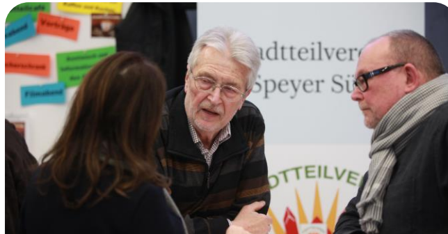
Startschuss der Sozialen Stadt Speyer-Süd